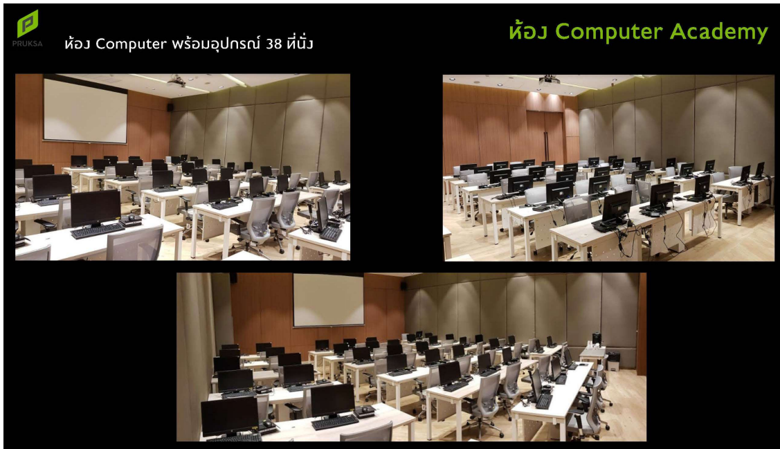
รูปที่ 5-2 สถานที่จัดอบรม อาคาร เพิร์ล แบงก์ค็อก (Pearl Bangkok)