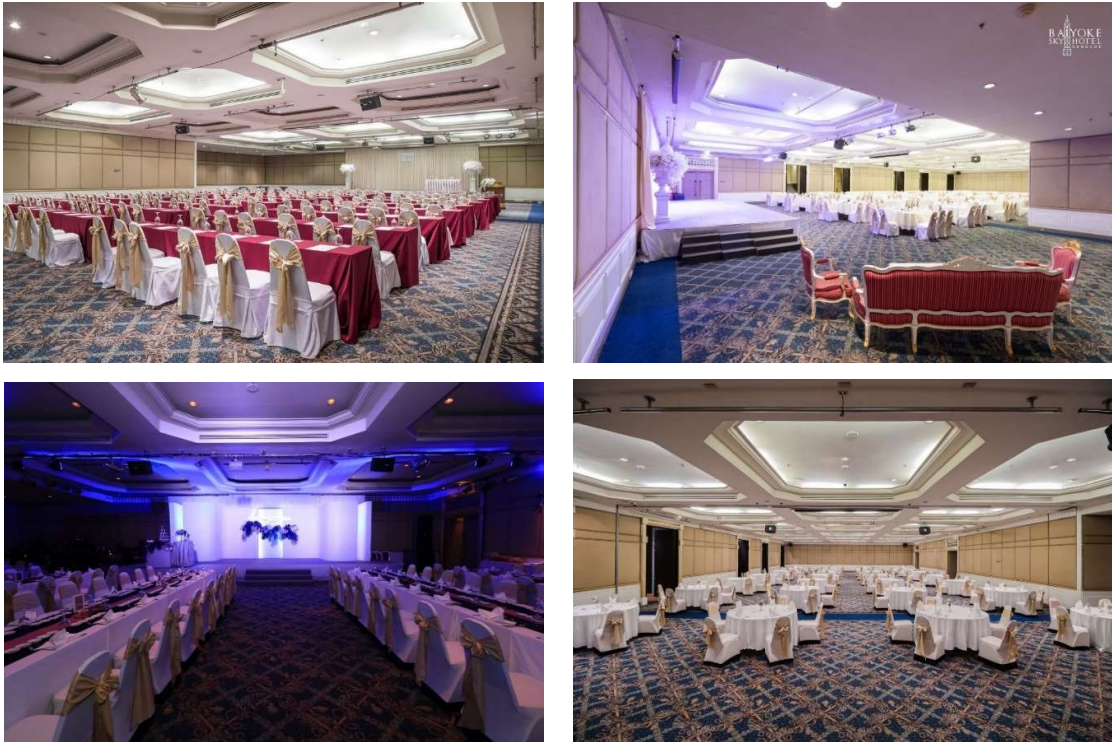
รูปที่ 5-1 สถานที่จัดสัมมนา ห้อง Rainbow hall โรงแรมใบหยกสกาย กรุงเทพมหานคร