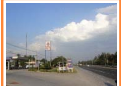
แขวงฯ นครราชสีมาที่ 2/สทล.8