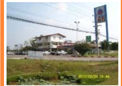
แขวงฯ พิษณุโลก/สทล.4