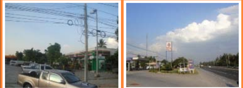
แขวงฯ นครราชสีมาที่ 2/สทล.8 ขบ.เป็นเจ้าภาพหลัก การประสานงาน