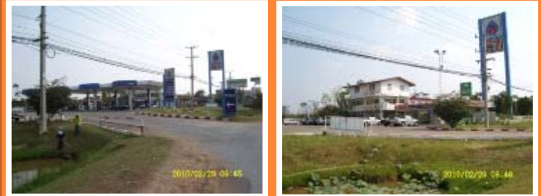
แขวงฯ พิษณุโลก/สทล.4 ขบ.เป็นเจ้าภาพหลัก การประสานงาน