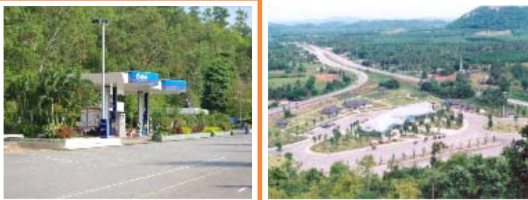
แขวงฯ ชุมพรร่วมแขวงฯ ประจวบคีรีขันธ์/สทล.13 ทล. เป็นเจ้าภาพหลัก การประสานงาน