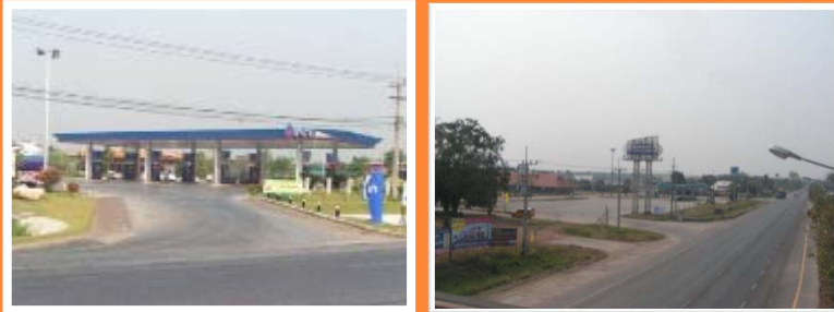
แขวงฯ กำแพงเพชร/สงล.ตาก ขบ.เป็นเจ้าภาพหลัก การประสานงาน