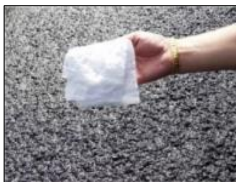
รูปที่ 1 การใช้กระดาษชั้บ เพื่อหา Initial Set Time

นอกจากการตรวจสอบเวลาในการแตกตัวหรือแยกตัวดังกล่าวแล้ว ในทันทีหลังจากที่ฉาบผิว จะต้องรีบทำการตรวจสอบความเรียบ ความสม่ำเสมอของผิวทางที่ฉาบ หากพบความไม่เรียบรอยใดๆ เช่นการเกิดเป็นรอยริ้ว หรือรอยลากเป็นเส้น หรือมีส่วนผสมไม่ทั่วถึงเป็นหย่อมๆ ต้องรีบทำการแก้ไขทันทีก่อนที่จะเกิดการแตกตัวหรือแยกตัว เพราะหลังจากนั้นแล้วจะแก้ไขได้ยาก